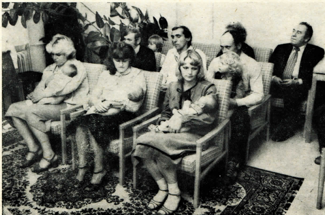
Z posledního vítání občánek